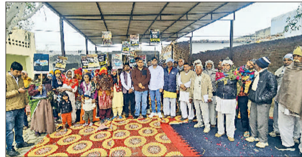
रेवाड़ी। बैठक में मौजूद कांग्रेसी कार्यकर्ता व ग्रामीण।

हरियाणा युवा कांग्रेस की ओर से सोमवार को कोसली विधानसभा क्षेत्र के गांव नांगल भगवानपुर में मनरेगा बचाओ संग्राम को लेकर बैठक का आयोजन किया गया। बैठक में भाजपा सरकार की ओर से मनरेगा के समानांतर नई रोजगार गारंटी योजना विकसित भारत-जी राम जी लागू किए जाने के विरोध में आयोजित की गई। बैठक का नेतृत्व हरियाणा युवा कांग्रेस प्रदेशाध्यक्ष निशित कटारिया व अध्यक्षता युवा जिला अध्यक्ष राज प्रकाश ने किया। बैठक में निर्णय लिया गया कि