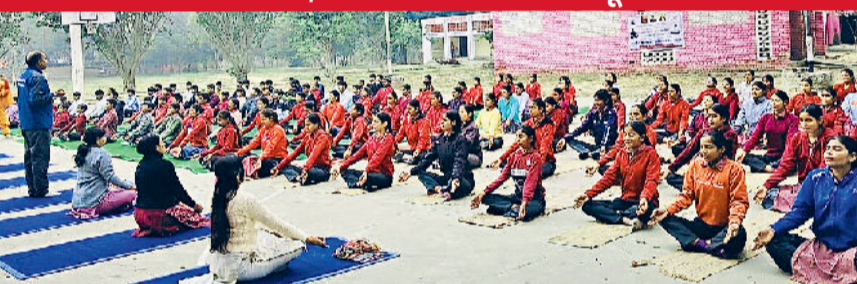
रेवाड़ी। सूर्य नमस्कार का अभ्यास करते हुए शिक्षक व विद्यार्थी।