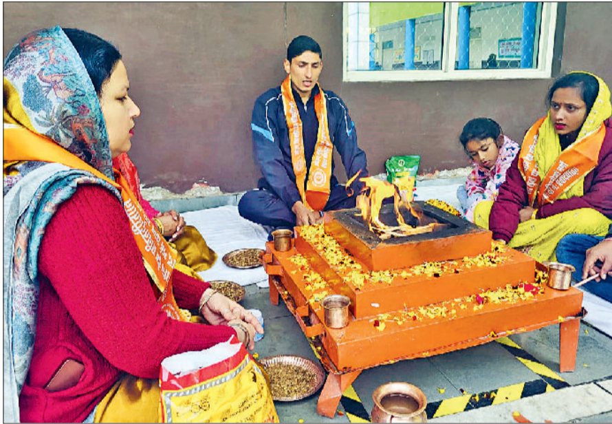
रेवाड़ी। डीएवी पुलिस पब्लिक स्कूल में हवन करते हुए।

शिक्षक पात्रता परीक्षा परीक्षा सात और आठ फरवरी (शनिवार व रविवार) को देशभर के 140 शहरों में कराई जाएगी। दोनों दिनों में परीक्षा दो पारियों में आयोजित होगी। पेपर-2 की परीक्षा सुबह 9:30 बजे से दोपहर 12:00 बजे तक, जबकि पेपर-1 की परीक्षा दोपहर 2:30 बजे से शाम 5:00 बजे तक होगी। प्रत्येक पेपर की अवधि दो घंटे 30 मिनट निर्धारित की गई है।