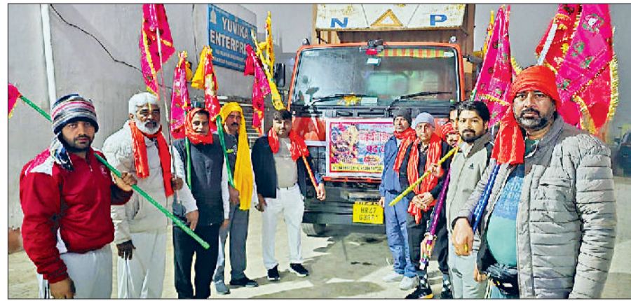
रेवाड़ी। खाटूधाम के लिए रवाना होते श्रद्धालु।