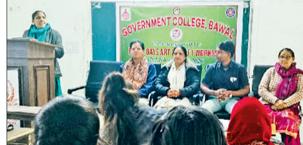
रेवाड़ी। कार्यशाला में छात्राओं को जानकारी देते हुए वक्ता।