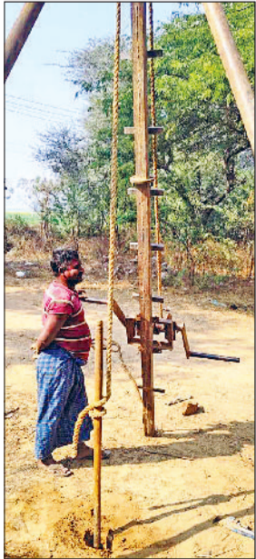
महेंद्रगढ़। मिट्टी के सैंपल लेते हुए।