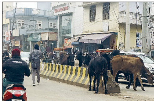
रेवाड़ी। सरकुलर रोड पर लिये चौक के पास ट्रैफिक बाधित करते गोवंश।

शाम के समय गोवंश के जमावड़े के कारण सरकुलर रोड स्थित नाईवाली चौक पर जाम भी लग जाता है। गोवंश सड़क पर बैठकर आराम फरमाते हैं। गोवंशके कारण वाहन चालकों को आवागमन में भारी परेशानी का सामना करना पड़ता है, वहीं सड़क हादसों की आशंका भी बनी रहती है।