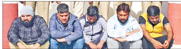
नारनौल। पुलिस गिरफ्त में आरोपित।